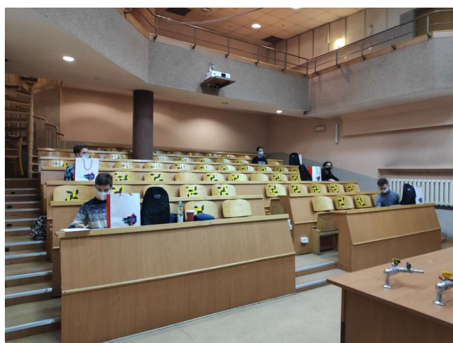
Wręczenie nagród olimpijczykom.