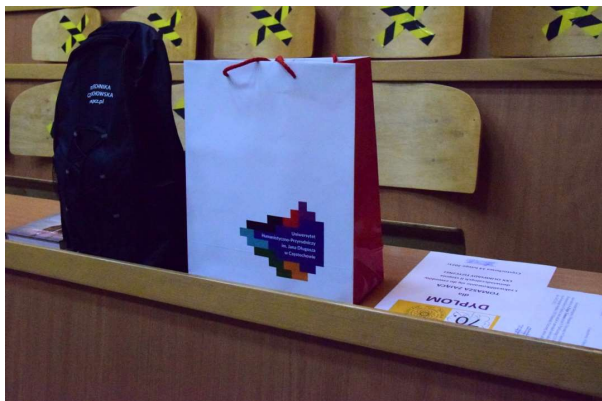
Nagrody dla olimpijczyków